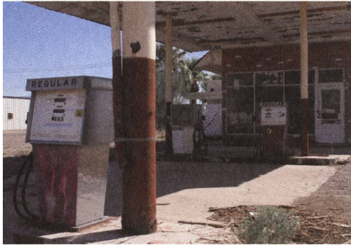
1973 – Ende des Benzintraums?

Sie kündeten an, ihre Erdölförderungen so lange erheblich einzuschränken, bis die von Israel besetzten Gebiete befreit wären. Gegen die USA und die Niederlande, die als Freunde Israels galten, wurde sogar ein vollständiger Lieferboykott für Erdöl verhängt. Damit sollte die westliche Welt gezwungen werden, die weitere Unterstützung für Israel aufzugeben.