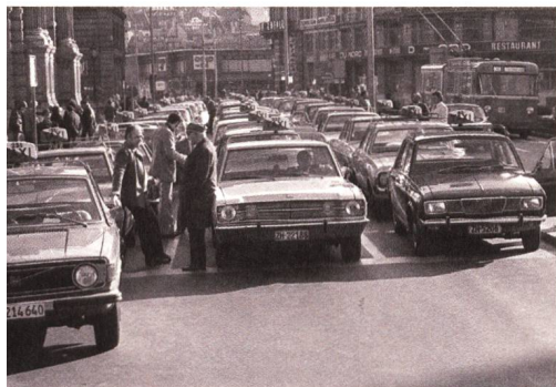
Während des Sonntagsfahrverbots waren Taxis und der öffentliche Verkehr heiss begehrt. Aufnahme vom Hauptbahnhof Zürich, 1973.

Die «Erdölwaffe», wie die Swisstopol die Erdöldrosselung und die Erhöhung der Preise durch die OPEC bezeichnete, zeitigte recht bald erste Ergebnisse: Im November 1974 forderten die EG-Aussenminister in einer Nahosterklärung Israel zur Räumung der seit 1967 besetzten Gebiete auf (seit dem 24. Oktober 1973 war ein UN-Waffenstillstand in Kraft). Im Dezember kündigten die OPEC-Länder eine Entspannung und die schrittweise Lockerung der Abgabebeschränkungen, die de facto nur gegenüber den USA und den Niederlanden bestanden hatten, an. Sie wurden schliesslich am 17. März bzw. am 10. Juli 1974 aufgehoben. Allerdings war die OPEC nicht bereit, den Preis zu senken, ganz im Gegenteil: Dieser belief sich inzwischen für ein Fass Erdöl auf 11.65 Dollar, auf diesem hohen Niveau sollte er während der weiteren 1970er-Jahre verharren.