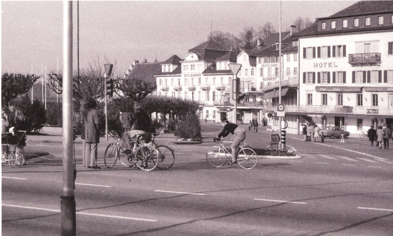
Autofreier Sonntag in Rapperswil, 25. November 1973.

Um wenigstens einen Teil des kostbaren Öls einzusparen, an dem es vermeintlich mangelte, verkündete der Bundesrat am 21. November 1973 folgerichtig ein Sonntagsfahrverbot für alle Autofahrenden und eine Geschwindigkeitsbeschränkung von hundert Stundenkilometern auf Autobahnen.