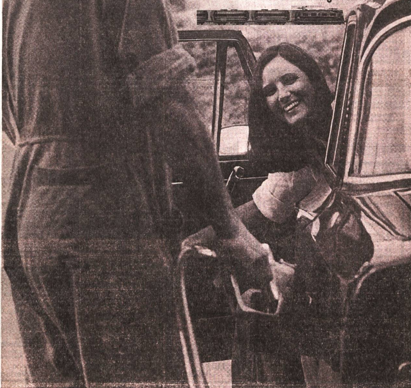
Die SBB betonten Ende der 1970er-Jahre in einer Anzeige in der «NZZ» ihre Kompetenz beim Transport von Erdölprodukten.