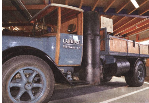
FBW-Kipper-Transporter, Baujahr 1929, umgerüstet auf Holzvergaser.