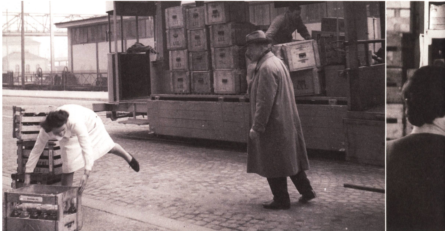
Warentransport per Tram in Zürich, 17. März 1941: Um spürbare Benzineinsparungen zu ermöglichen, stellte die Zürcher Strassenbahnverwaltung ihre Materialwagen dem privaten Stadt-Gütertransport zur Verfügung.

von Import, Lagerung, Rationierung und Verteilung sämtlicher flüssiger Kraft- und Brennstoffe. Ihr oberster Zweck war eine möglichst vollständige Erfassung und Verteilung dieser Güter, unter besonderer Berücksichtigung von Armee und Kriegswirtschaft. Die Zuteilungen mussten auf lange Dauer gesichert sein. Deshalb wurde der Markt ausser Kraft gesetzt: Man rationierte die Erdölprodukte, lenkte den Verbrauch, sicherte die Lagerhaltung und bemühte sich, das erforderliche Warenverteilungsnetz aufrechtzuerhalten. Dabei war die Vorratshaltung bei Ausbruch des Krieges ausserordentlich prekär.