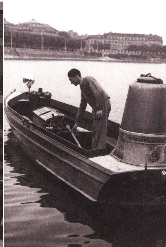
Das erste Motorboot mit Holzgasgenerator auf dem Neuenburgersee, 1943. Die Reinigung des Gases erfolgte durch Spezialfilter mit Wasser aus dem See.

Der Bund musste sich für die Beschaffung von flüssigen Treib- und Brennstoffen nach Kriegsbeginn mühsam neu orientieren. Die weltweiten Ereignisse hatten das bisherige Versorgungsnetz vollständig umgewälzt. Die überseeischen Länder waren durch den Zusammenbruch Frankreichs und den Kriegseintritt Italiens als Lieferanten ausgeschaltet worden. Sinkenden Einfuhren standen zudem erhöhte Beschaffungskosten gegenüber. Der Benzinpreis stieg kurz nach Kriegsausbruch um das Zweieinhalbfache, die Rohölpreise einschliesslich der Transportkosten wiesen gar eine Steigerung um das Sechsfache auf. Dass es bei den Bemühungen, das Land angemessen mit Erdöl zu versorgen, auch zu aus heutiger Sicht unlauteren Kontakten mit dem nationalsozialistischen Deutschland kam, sei als Randbemerkung angeführt.