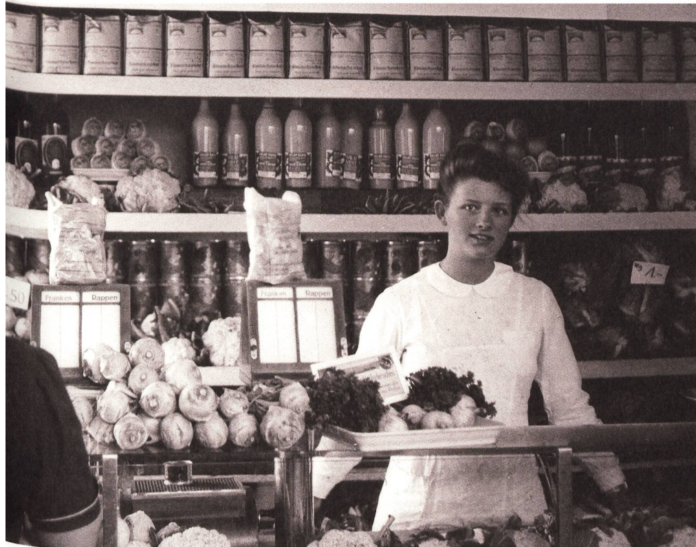
Begrenzte Auswahl: Im Zweiten Weltkrieg waren nicht nur die Rohstoffe, sondern auch die Lebensmittel rationiert.