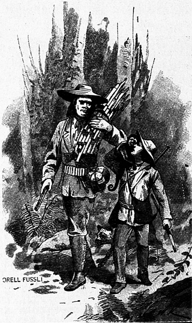
Der schweizerische Robinson.

getragen, sondern eine dichterische, fast ungebundene Phantasie stellt es in hundert Abenteuern dar, so dass der Knaben Augen heute noch leuchten, wenn sie das Werk lesen. Die Erzählung, schlicht, einfach und herzlich, ist der Jugend so angepasst, wie nur ein Vater, der selber seine Kinder auf tausend Spaziergängen begleitet und mit ihnen vertraulich verkehrt hat, erzählen kann. Der schweizerische Robinson von Pfarrer Wyss ist noch heute eines der schönsten Weihnachtsgeschenke und sollte auch in keiner Jugendbibliothek fehlen. Die Ausstattung der 7. Auflage in Papier und Druck ist vorzüglich, die Bilder einfach und oft entzückend.