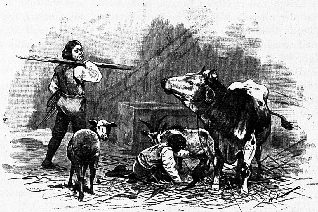
Der schweizerische Robinson.