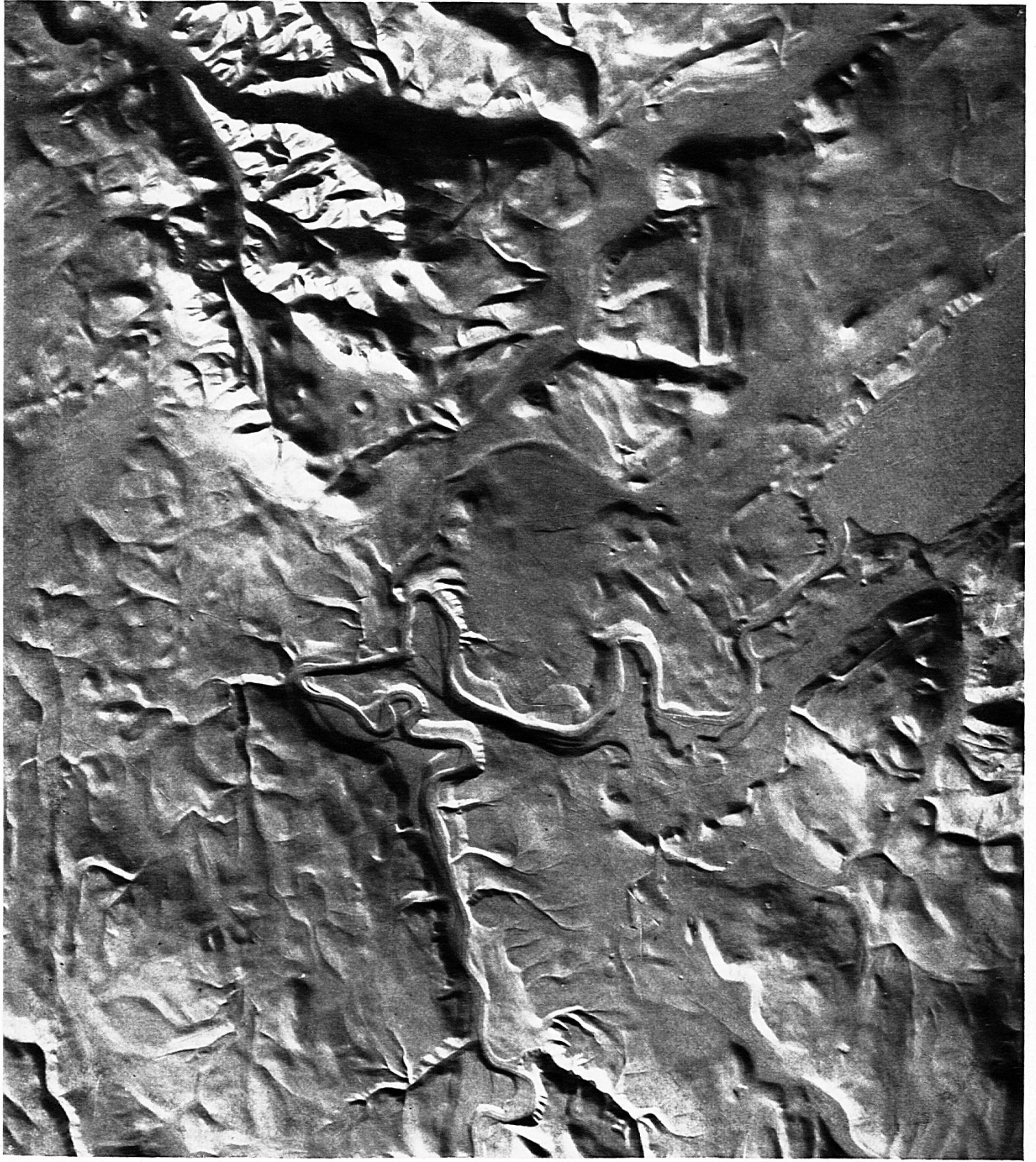
Fig. 1. Reliefbild der Umgebung Berns.