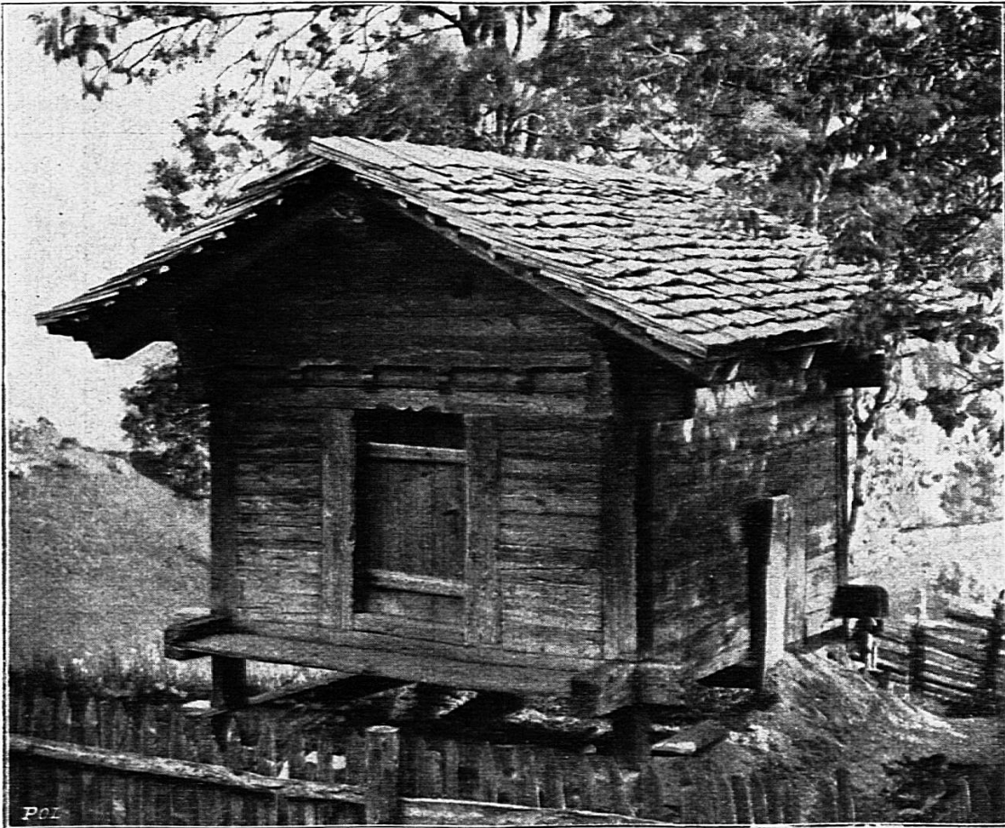
Speicher in Grindelwald.

ganzen Bernerland die hervorragendsten Speicher aufgesucht, photographiert, die Sprüche notiert und aus 300 Photographien die markantesten in diesem Werk veröffentlicht, dass gross und klein, Herr und Bauer ihre Freude daran haben werden. Herr Prof. Dr. Weese in Bern hat bei der Auswahl mitgewirkt und nebst dem heimatkundigen Pfarrer Friedli die Sammlung mit einem freundlichen Vorwort eingeleitet, während der Verfasser in ganz knapper Form einen erklärenden Text zu den 100 Speicherbildern geliefert hat mit einem Anhang von Bausprüchen. Das Polygraphische Institut hat das Buch ausgezeichnet ausgestattet. Der Preis von Fr. 5 erscheint für ein so geschmücktes und in jeder Hinsicht wertvolles Buch äusserst billig.