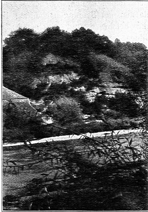
Vestihubel in Gümmenen.

Hofacker, wo sie die vom Werkmeister Burkhard errichteten grossen Wurfmaschinen aufstellten, deren Geschosse die Mauern auf dem Vestihubel mit Erfolg trafen. Dieser Werkmeister Burkhard verteidigte sieben Jahre nachher mit seinen Maschinen auch Stadt und Schloss Laupen. Er wurde sogar von der Stadt Strassburg berufen zur Eroberung des Raubritternestes, auf einer Rheininsel und seine Wurfmaschinen arbeiteten auch dort mit solchem Erfolg, dass ihm die Strassburger eine lebenslängliche Pension gaben. Die Wurfmaschinen Burkhard's müssen sich durch grössere