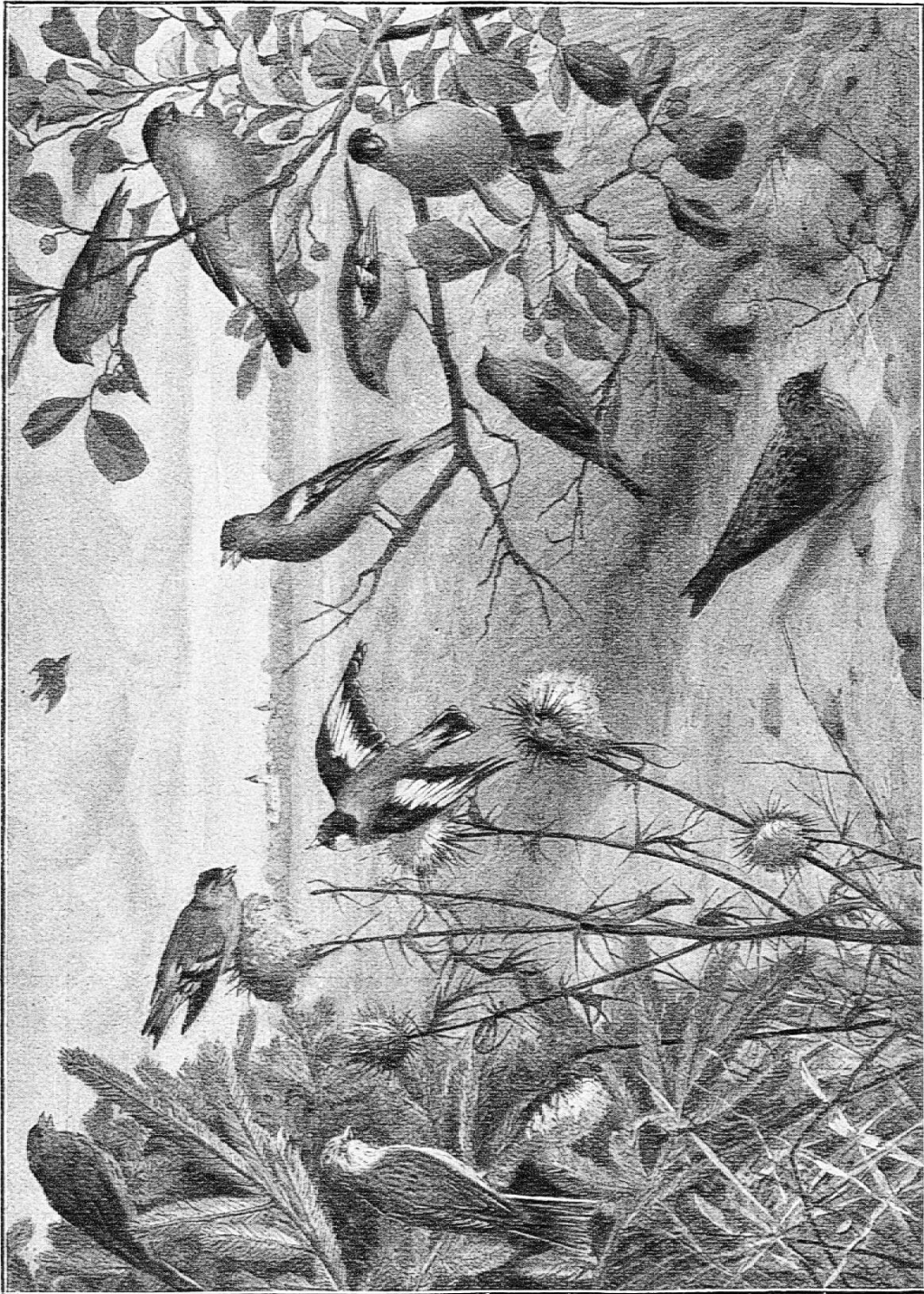
Gimpel, Männchen und Weibchen; Hänfling; Buchfink, Männchen und Weibchen; Zeisig, Männchen und Weibchen; Stieglitz; Goldammer, Männchen und Weibchen; Baumpieper; Feldlerche.

Tafeln besteht ferner darin, dass sämtliche Arten in der für sie charakteristischen Landschaft, also mit ihrer natürlichen Umgebung, dargestellt wurden. Aus diesem Grunde und um eine widernatürliche Zusammendrängung und Anhäufung der verschiedensten Formen nach Möglichkeit zu vermeiden, wurde jede Tafel in vier Einzelbilder zerlegt, die mit der stimmungsvollen Landschaft im Hintergrunde und den lebensvollen Tiergestalten im Vordergrund gewiss einen ebenso schönen und wirkungsvollen wie nützlichen und belehrenden Schmuck nicht nur für die Schulstube, sondern auch für das Zimmer des Naturfreundes abzugeben geeignet sind. Dabei ist