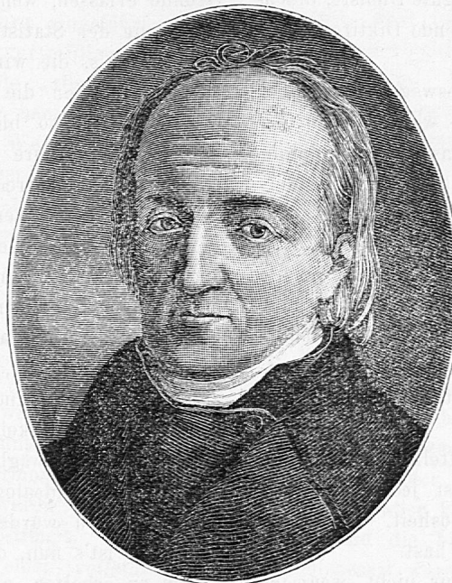
Emanuel von Fellenberg