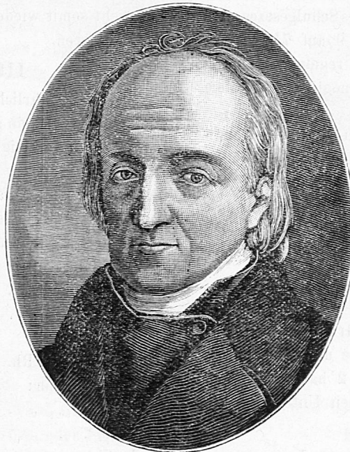
Emanuel von Fellenberg