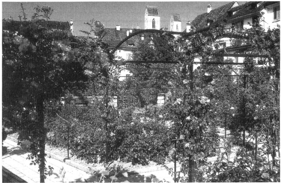
Rapperswil wahrlich eine Rosenstadt

Richterstübli -das auch Trauzimmer ist- der Ortsverwaltungsrat.