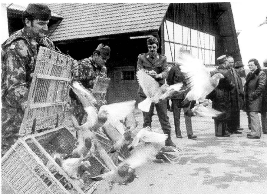
Gute Reise! Das Auflassen von Brieftauben