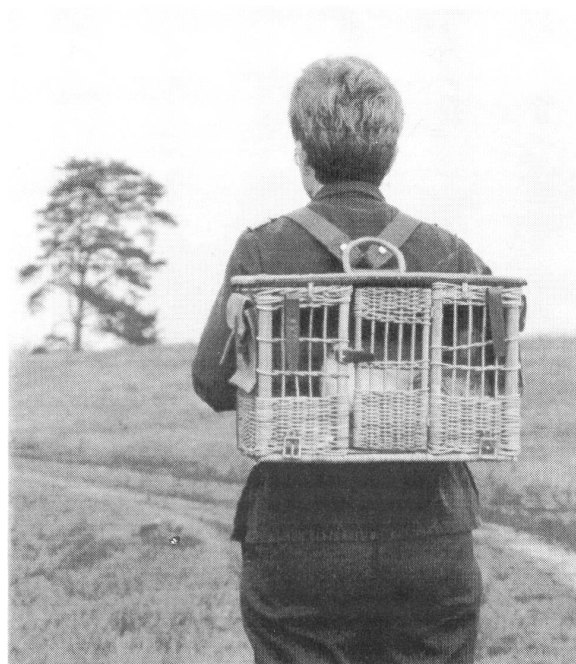
Tauben fliegen nicht nur, sie werden auch getragen.

Die Brieftaube, wie sie die Schweizer Armee gehalten hat, ist nicht irgendeine Taube: columba militaris helvetica heisst sie, und weil sie sogar unter den Brieftauben etwas Besonderes ist, fliegt sie auch nach ihrer vielfach beklagten Ausmusterung weiter. Die ehemalige Brieftaubenstation Sand ist in eine