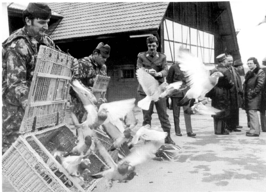
Gute Reise! Das Auflassen von Brieftauben

Wer eine Brieftaube «findet», meldet das dem Zugeflogendienst für Brieftauben Telefon 031 859 06 69 Fax 031 859 17 02