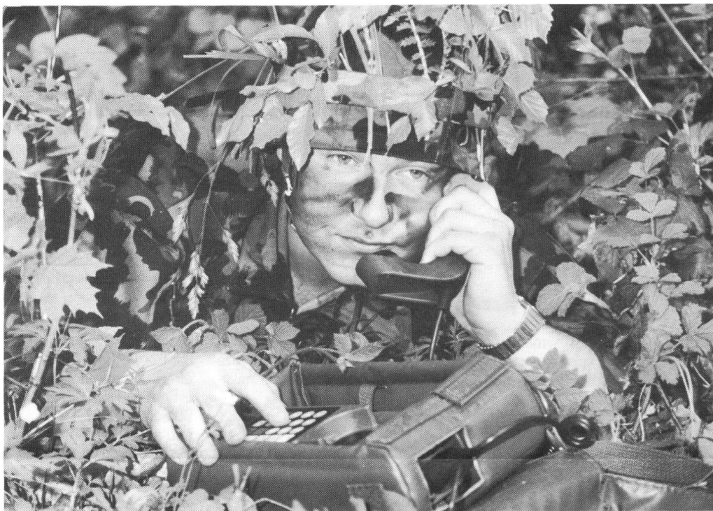
Le téléphone de campagne doit être aussi facile à utiliser que le combiné civil posé sur la table de nuit.

Le téléphone de campagne 96 à la troupe dès 1998.