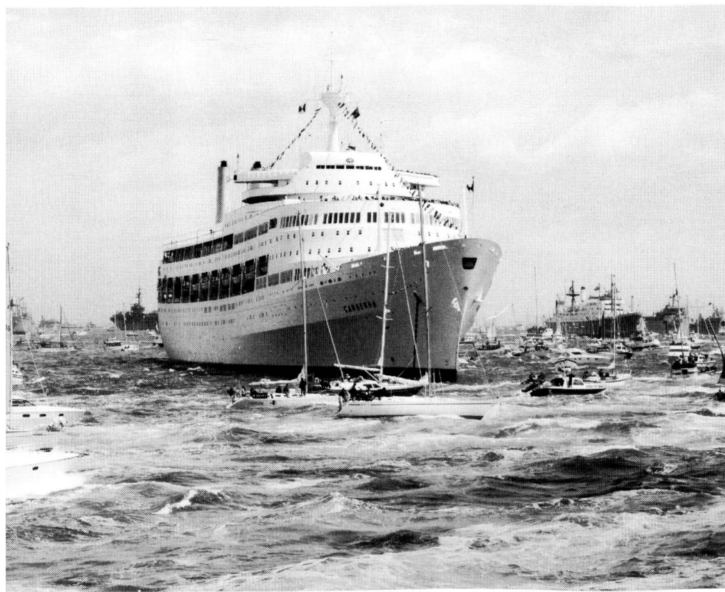
Die «Canberra» am «D-Day»-Jubiläum 1994 vor Southampton. Sie ist festlich über die Toppen beflaggt, hat an Bug und Mast die Flagge ihrer Reederei gesetzt, und am Mast weht die Flagge der «Royal British Legion» (Veteranenvereinigung). Die Nationalitätsflagge (nicht sichtbar) weht am Heck.

Sichtkommunikation auf See besteht aber nicht nur aus den offiziellen Signalflaggen. Bis in die Mitte des letzten Jahrhunderts verbreitete ein ganz besonderes Tuch auf allen Weltmeeren häufig Angst und Schrecken: «Jolly Roger», die schwarze Flagge mit dem weissen Totenkopf, das Zeichen der Piraten. Sogar vor fünfzig Jahren, 1948, wollte es eine «traditionelle» Räuberbande noch einmal wissen: in der Karibik machte sie sich unter dem Jolly Roger auf Raubfahrt, bevor sie von einem Schiff der Royal Navy zur Räsion gebracht wurde. Damit die Sache mit Jolly Roger nicht zu einfach ist: er kann auch etwas anderes bedeuten. Wenn ein U-Boot der