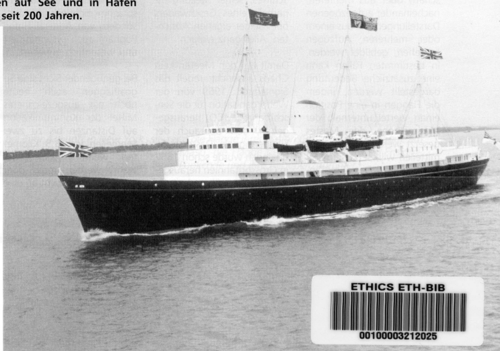
HM/Y (Her Majesty's Yacht) Britannia auf See: gezeigt werden (am Bug) die Britische Unionsflagge und (am Heck) das «White Ensign», die Flagge der Royal Navy. Da die Königin an Bord ist, wehen ihre Flaggen an den Masten: die Lord High Admiral-Flagge, die königliche Flagge und die Unionsflagge.

* England erwartet, dass jeder Mann seine Pflicht tut.