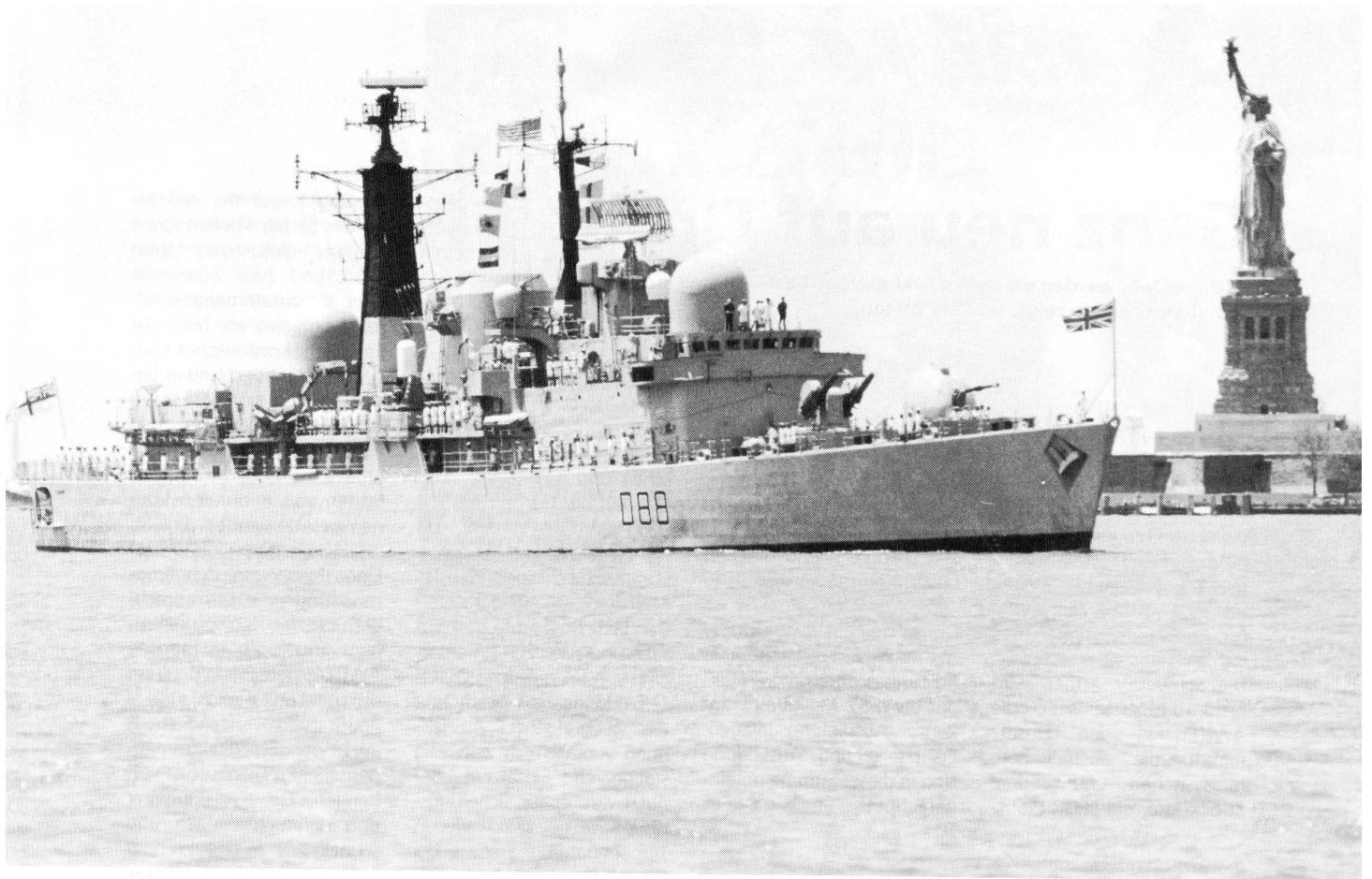
Die HMS Glasgow, ein Zerstörer, bei ihrer Ankunft in New York: sie zeigt die Flagge ihrer Nation (Britische Unionsflagge am Bug), des Landes, in dessen Gewässern sie sich befindet (USA, am Mast), die Flagge der Royal Navy («White Ensign», am Heck), zudem (am Mast), dass sie einen Lotsen an Bord hat, ihren Funkcode und ihre Liegeplatznummer.

Royal Navy einen Feind versenkt hat, setzt es beim Einlaufen in den Heimathafen den weissen Totenkopf auf schwarzem Grund, einer Tradition aus dem Jahre 1917 folgend. Das letzte Mal ist das 1982 geschehen, als das U-Boot HMS Conqueror im Südatlantik die General Belgrano versenkt hatte und in Faslane einlief.