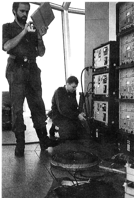
Ein Teil der Anlagen in der Richtstrahlkanzel.

«Prüfstand Schweiz» Ausblicke im Jubiläumsjahr, ISBN 3-85717-067-0, 164 Seiten, illustriert, Fr. 37.–, Th. Gut & Co. Verlag, 8712 Stäfa.