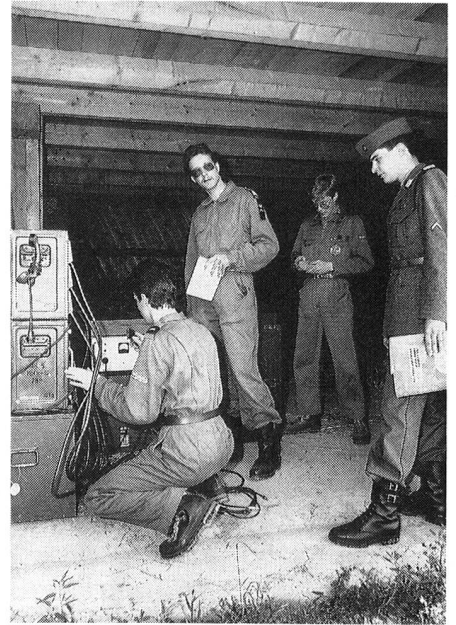
Richtstrahlverbindung (Ristl Vrb): aufgebaute Schaltstelle.

Nach einem Situationsbericht seitens der Polizei gab's nun eine Pause und einen Kaffee, denn das örtliche Restaurant hatte selbstver-