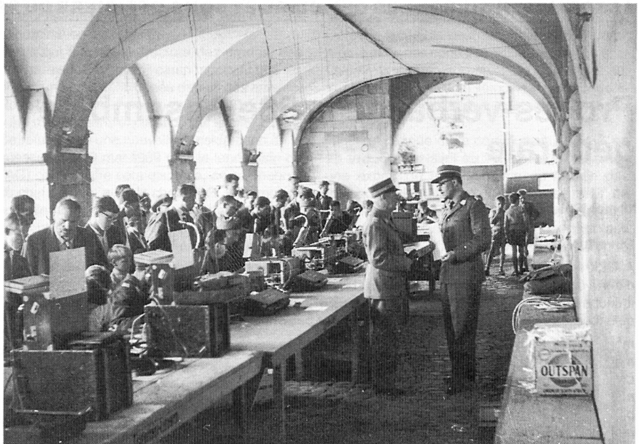
Hauptzentrum unter der Egg – ein Publikumserfolg.

Bereits im April 1989, am Tag der Übermittlungstruppen, wurden mittels EDV durch die Sektion Luzern der Übermittlungslauf ausgewertet und die Ranglisten erstellt. 1990 wurde bereits wieder ein erster EDV-Kurs durchgeführt, der seinen Abschluss am 6. März 1990 hatte. Übereinstimmend kamen die Teilnehmer