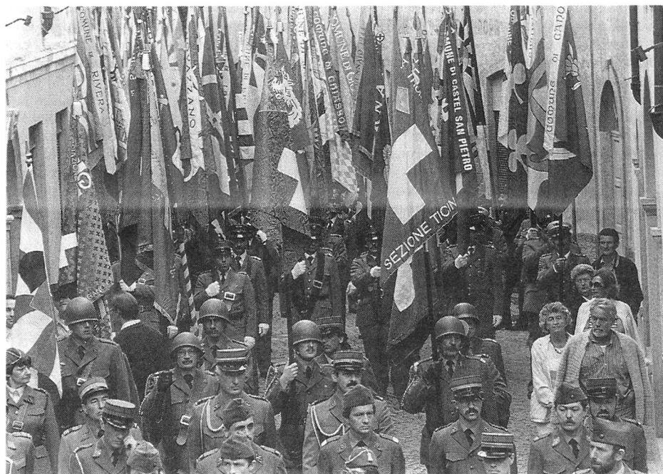
Uniti verso il futuro.

Les cas d'espionnage en faveur des pays de l'Est peuvent être répartis en trois catégories: renseignements politiques (principalement sur des émigrés), renseignements économiques et renseignements militaires.