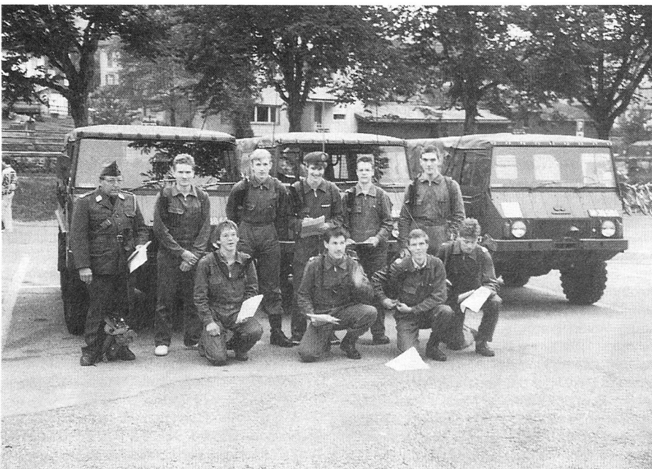
Mitglieder am Sonntagmorgen vor der Übung mit dem SE-227. (Selbst ZHD in voller Montur, links aussen!)

Jedes Jahr findet in Altstätten im September der Städtlilauf statt. Über 1500 Teilnehmer werden in den einzelnen Kategorien gezählt. Ebenso viele Zuschauer säumen jedes Jahr die Laufstrecke. Dabei bildet sich im alten Städt-