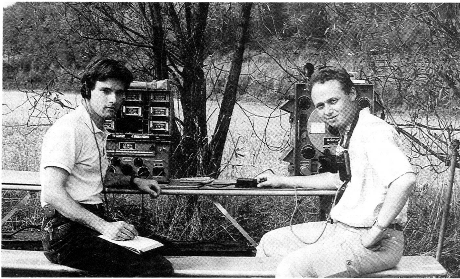
Die Initiatoren des FACB, zwei Firstclass-Funker, vor der FL 40 / TS 40 live.

Bundesamt für Übermittlungstruppen Sektion Planung, 3003 Bern