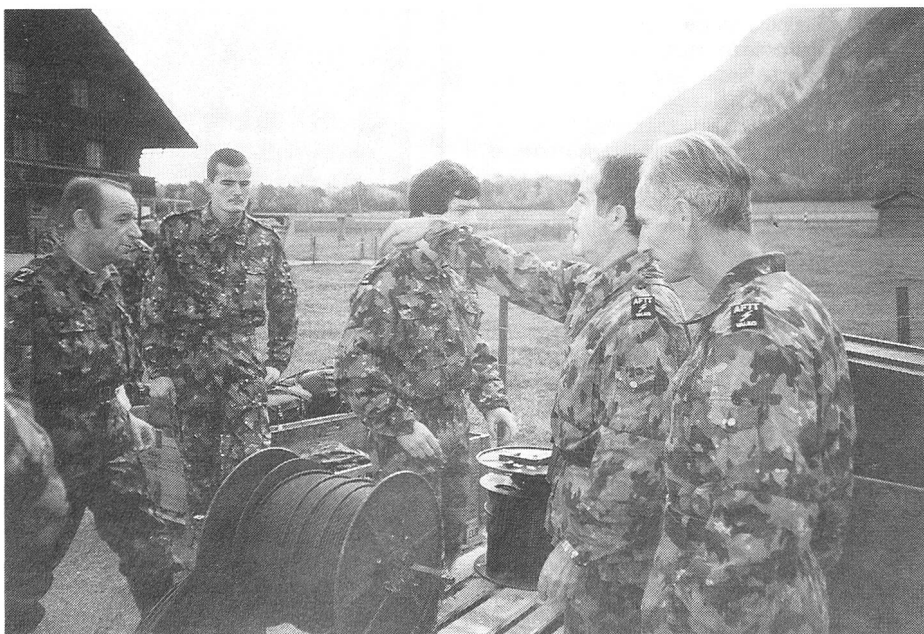
Ordre de Montage à Finges.