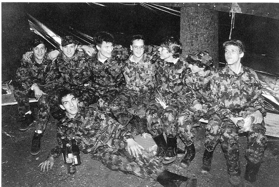
Die Mittelrheintaler Delegation in Pose.