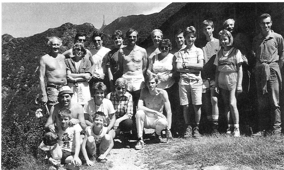
Villa baffo e la «piccola antenna» Tamaro.

È stato bellissimo. Queste le parole dell'arrivo- derci per la prossima volta. E vissero felici e contenti. Così terminano le fiabe, ma non sempre sono fiabe!