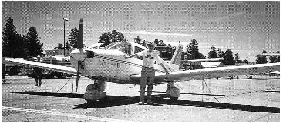
Le vent est tel que l'on est obligé d'amarrer les avions par des chaînes, sous les ailes.