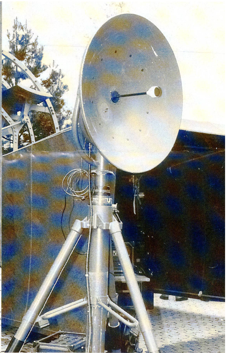
Ein Technologiesprung: Die Richtstrahlstation R-915, hier an der KOM 89 in Luzern