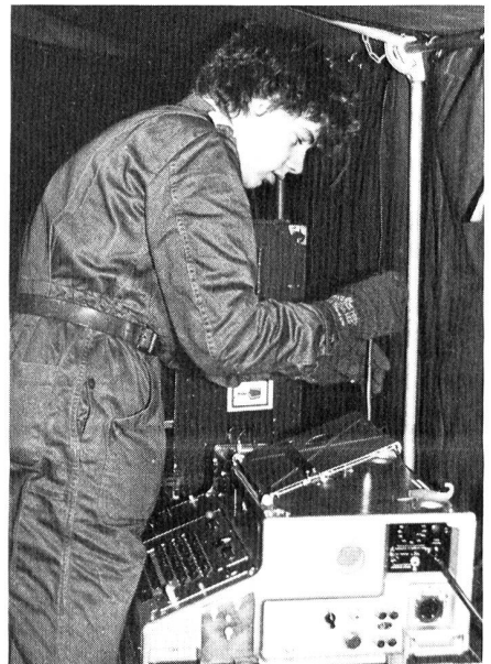
Auch bei eisiger Kälte bringt ein EVUler einen KFF zum Laufen. Die Übung PEGASUS darf trotz der eher misslichen Wetterverhältnisse als Erfolg gewertet werden.

Das Wetter war uns an diesem Tag nicht eben wohlgesinnt. In der Stadt bewegten sich nur halb so viele Leute wie sonst an Samstagen üblich. Die Suppe und die Käseküchlein wurden zunächst nur schleppend abgesetzt. Vielen Leuten war es schlicht zu kalt, um ihre Aufmerksamkeit länger als ein paar Minuten dem militärischen Treiben zu widmen. Erst als zum Rückzug geblasen wurde, war die Kälte etwas gewichen, und die Suppentöpfe wurden schliesslich doch noch leergegessen.