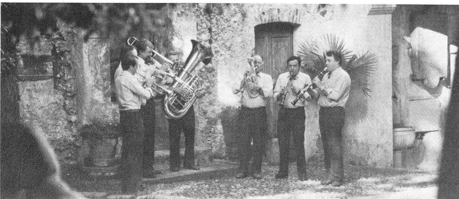
La BANDELLA TT si esibisce magistralmente nel castello Visconteo in occasione dell'aperitivo gentilmente offerto dal Municipio di Locarno.

A partire dal 1° gennaio 1986 la nuova tassa sociale ammonterà quindi a fr. 15.-.