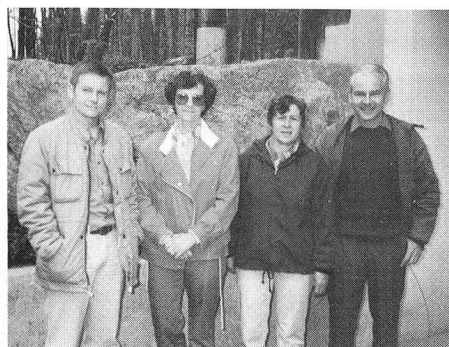
Das Siegerteam aus Winterthur

Danach erwartete die Fahrer ein Landrover. Landroverparcours, aufgestellte Büchsen, Zeitlimit und fahrerisches Können sind Stichworte über den ersten Teil. Während sich der Fahrer bemühte, keine Strafpunkte zu erhalten, musste der Beifahrer den Fahrer porträtieren. Die