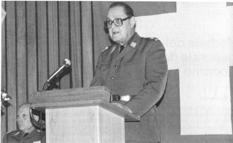
Su proposta del Comitato centrale, l'assemblea generale nomina socio onorario il colonnello Bernard Delaloye.

In questi giorni ci è pure pervenuta la richiesta d'ammissione di 28 nuovi camerati che si trova- no a Bülach al corso di sottufficiali tg tf da campo rispettivamente al corso per la formazio- ne di capo S. Queste domande d'ammissione