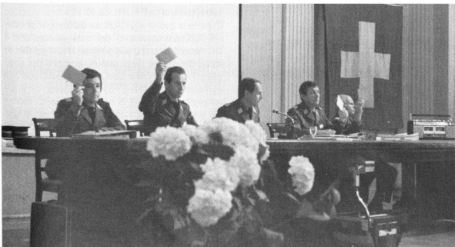
La sala della Sopracenerina dà ampio risalto alla 54 a assemblea generale. Il Comitato centrale si è prodigato con ogni mezzo pur di raggiungere i propri obiettivi; ha ottenuto i favori assembleari per il nuovo regolamento di tiro e per il sostegno del PIONIER. Doppio HURRÀ!

Alla richiesta da parte del presidente centrale se ci siano delle modifiche d'apportare all'ordine del giorno o al sistema di voto, i presenti rispondono negativamente.