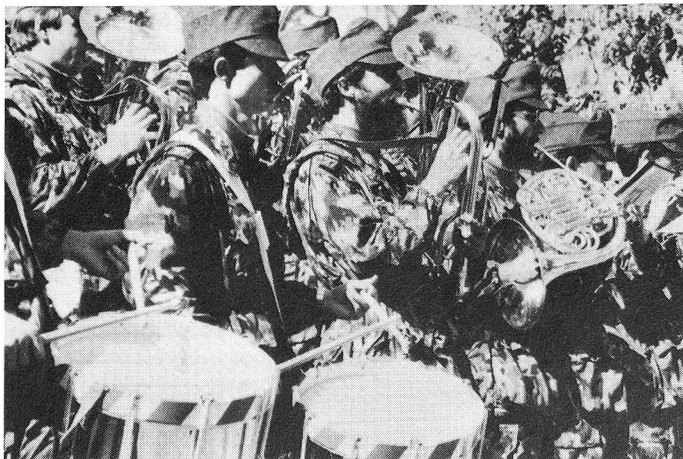
Ein Militärspiel in Aktion! Obwohl unsere Militärmusiker nur während drei Wochen jährlich als geschlossene Formationen spielen, müssen sie vom ersten Dienstag an voll einsatzbereit sein, ohne zuvor zusammen geübt zu haben. Ihr Können und ihr musikalisches Niveau sind weltweit anerkannt. Die neue Schallplattenserie «Unsere Märsche» enthält Kostproben aus dem reichen Marschrepertoire der Schweiz.