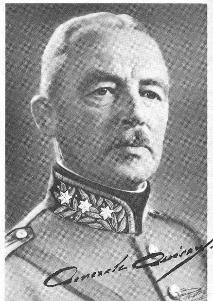
L'8 aprile 1960

Una pubblicazione che spiegherà dettagliatamente tutte queste novità, dal titolo francese «Le SCF devient SFA», uscirà entro il mese di giugno, sarà mia premura tenervi informati e aggiornati. Sandra Isotta