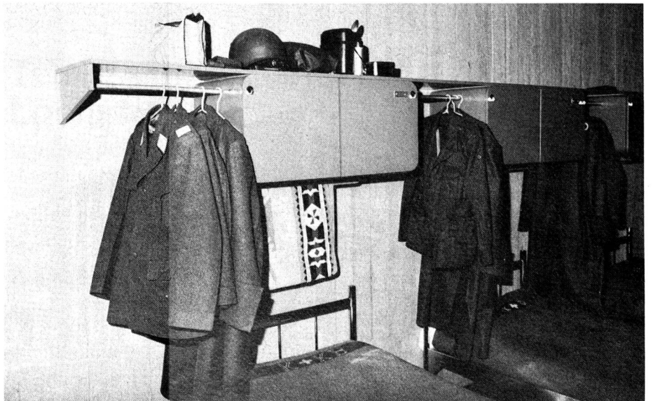
«Komfortable» Schlafstellen mit je zwei persönlichen, verschliessbaren Kästchen