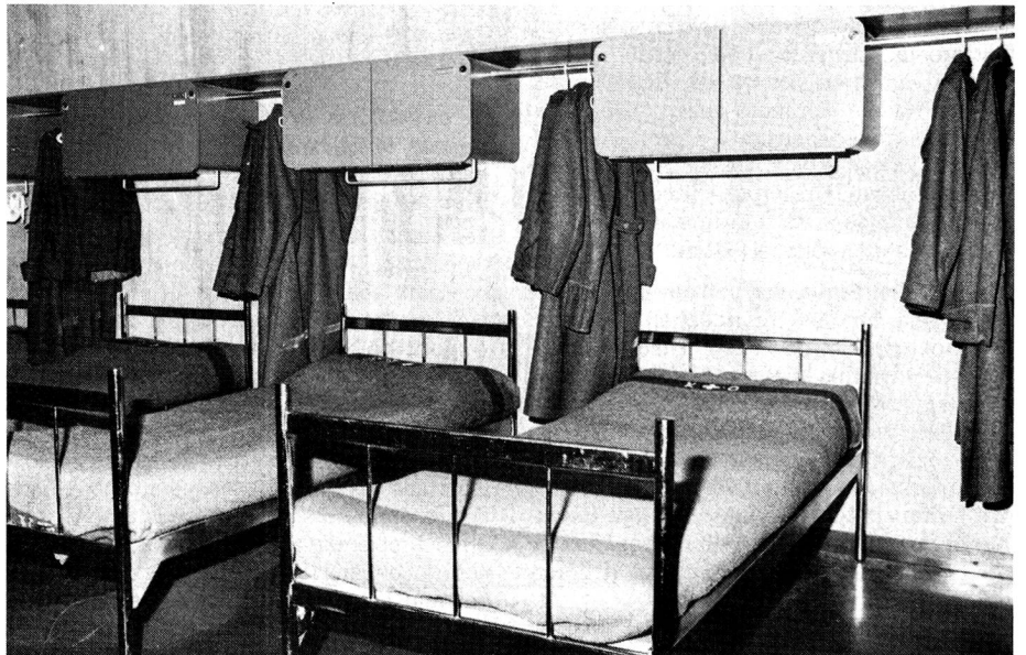
Interieur eines ZwölferschlaftsaaIs der Kaserne Kloten

Die jungen Leute bewegen und geben sich heute viel unkonventioneller und freier als früher, auch in der Rekrutenschule. Die Atmosphäre ist lockerer; die Autoritätsgläubigkeit geringer. Jeder Wehrmann kann heute in persönlichen Angelegenheiten zu jedem Vorgesetzten, d.h. ein Rekrut kann Audienz beim Schulkommandanten erhalten, ohne auf dem Dienstweg (über alle seine Vorgesetzten) darum zu ersuchen. Ich erachte es als positiv, dass ich oft von Schulangehörigen aller Grade, also auch von Rekruten aufgesucht werde. Ich fühle so etwa