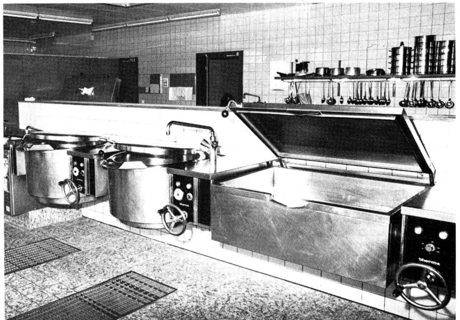
Grosszügig und modern eingerichtete Kompanieküche, Kaserne Kloten

Colonel, nous tenons à vous remercier de votre aimable accueil; nous voudrions ajouter que nous avons ressenti une très agréable atmosphère dans cet entretien et avons le sentiment que vous êtes un partenaire très engagé et très ouvert. Nous espérons que cet interview aidera à continuer vos efforts dans la formation de jeunes pionniers sans antimilitarisme. Rédaction PIONIER