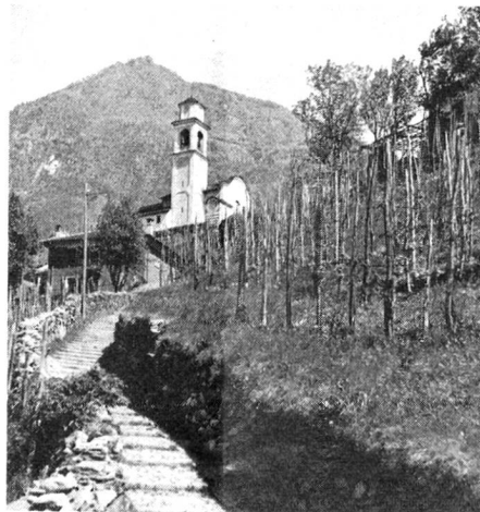
Kirche von Artore bei Bellinzona/Tessin

La plus ancienne et la plus grande des trois forteresses, le Castel Grande, possède de vastes installations de défense. Dès le VI e siècle, on la trouve mentionnée à plusieurs reprises dans des documents. L'immense cour, ouverte au public, servait certainement de refuge à la population. Des ruelles en pente mènent de la vieille ville à la colline du château, d'où l'on jouit d'une vue magnifique sur les toits