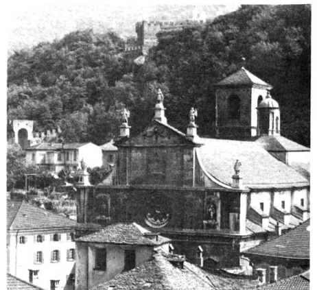
Renaissancefassade der Kollegiatskirche SS. Pietro und Stefano in Bellinzona, der Hauptstadt des Tessins.

Les samedis entre sept heures du matin et environ midi, le centre de la ville se transforme en un marché animé haut en couleurs. Les habitants font leurs emplettes, se rencontrent, discutent. Les touristes flânent le long des stands et admirent les étalages: fruits, viande, saucisses, fromages du val Muggio, de la Leventine et du val Maggia, pains de toutes sortes, mais aussi habits, souliers et objets manufacturés. Et il arrive souvent qu'un petit orchestre tessinois, une bandella, joue des airs populaires.