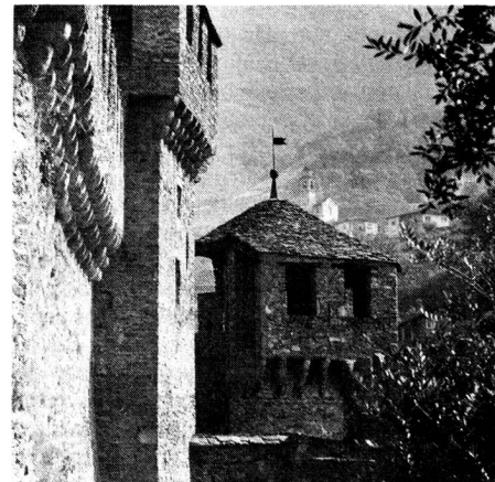
Das Schloss Schwyz oder Montebello aus der 2. Hälfte des 15. Jahrhunderts in Bellinzona/Tessin.