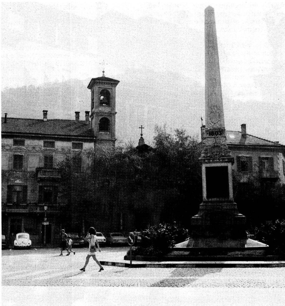
Obeliskendenkmal zur Erinnerung an den Eintritt des Kantons Tessin in die Eidgenossenschaft auf dem Hauptplatz in Bellinzona. Im Hintergrund das Castello Sasso Corbaro (Unterwalden).

Kunstfreunden seien drei Gotteshäuser zum Besuch empfohlen. Die Kollegiatskirche SS. Pietro e Stefano, ein bedeutender Renaissance-Sakralbau mit barockem Innern, dominiert die Piazza Collegiata. In der ehemaligen Franziskanerkirche Santa Maria delle Grazie, an der Strasse nach Lugano, fasziniert die Darstellung der Kreuzigung, ein monumentales Renaissancefresko. Die kleine romanische Kirche San Biagio im südlichen Vorort Ravecchia birgt Reste von Wandmalereien aus der lombardisch-sienesischen Schule des 14. Jahrhunderts.