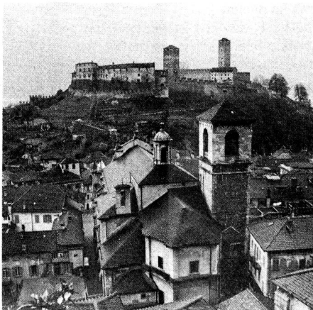
Bellinzona, Hauptstadt des Tessins. Blick über die Kollegiatskirche SS. Pietro und Stefano auf das Castello Grande aus dem 13. Jahrhundert.