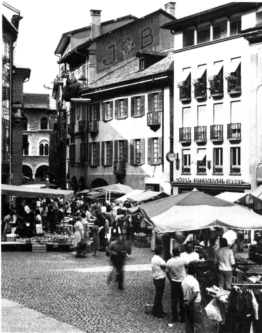
Markt auf der Piazza Collegiata in Bellinzona