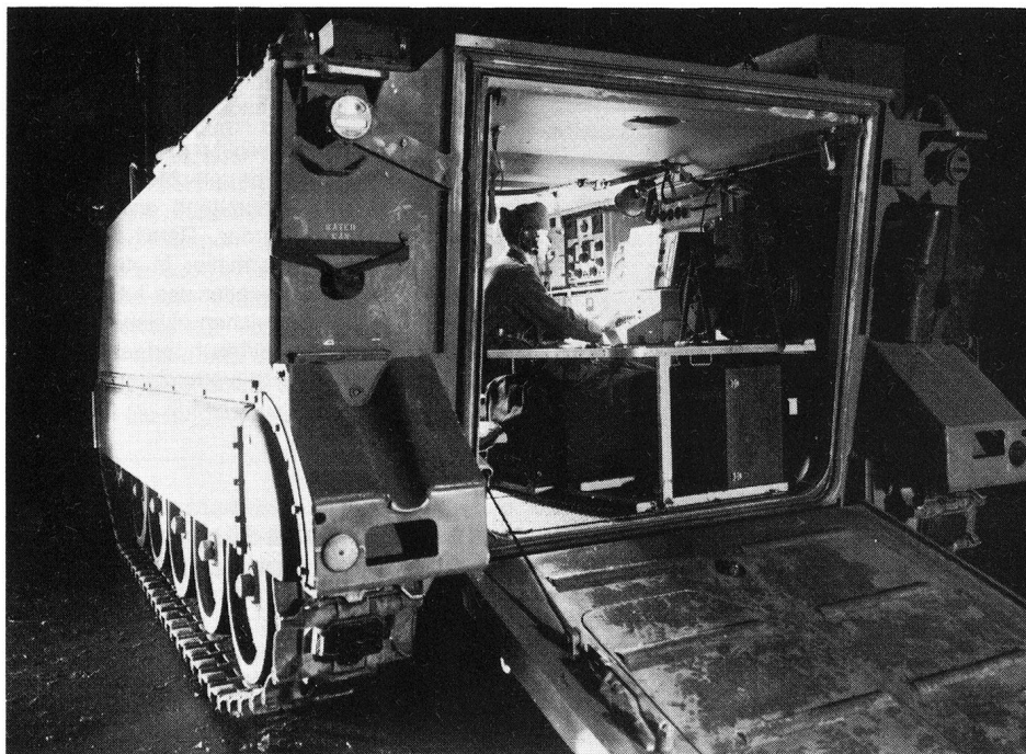
Übermittlungsschützenpanzer mit Funkfernschreiberstation SE-222/KFF

Die technischen Einrichtungen der Übermittlungstruppen transportieren oder verarbeiten Informationen und sind deshalb Angriffspunkte höchsten Interesses für jeden Gegner. Neben der Funktion des selbständigen Fernmeldefachmanns hat deshalb jeder Übermittlungssol-