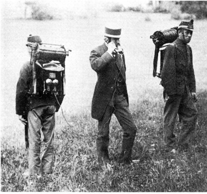
Die ersten Telefonapparate 1888

rial – wie etwa das Feldkabel F4 oder die Funkstationen SM-46 und FIX – erworben werden, schweizerischer Herkunft war die 1946 vorgestellte Dezimeterstation TLD. Ebenfalls in diese Zeitspanne fallen unter anderem die Beschaffung und Einführung des Kleinfunkgerätes FOX, der motorisierten Kurzwellen-Grossfunkstation M1K und des Kombinations-Kleinfernschreibers ETK.