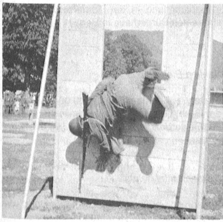
baffo in azione