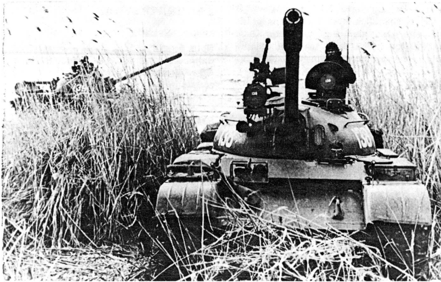
Sur le front atlantique 21 100 chars du Pacte de Varsovie s'opposent à 7 000 engins de l'Otan. Ci-dessus un T 55 (35 tonnes / soviétique).

dres — «The Military Balance 1978—1979» — publié en automne dernier, environ 50 000 chars lourds et moyens soviétiques existaient à cette date. Et, sur le front atlantique, le rapport des forces s'avérait nettement favorable à l'Est. En effet, sur les secteurs Nord et Centre, environ 21 100 chars adverses (dont 13 650 soviétiques) s'opposaient à seulement 7 000 engins de l'OTAN, c'est-à-dire dans un rapport de 3 à 1. Sur la partie sud de la ligne de contact, la supériorité de l'Est est moins écrasante, mais se traduit néanmoins par la présence de 6 800 chars de l'Est (dont 2 500 russes) face à seulement 4 300 des forces atlantiques.