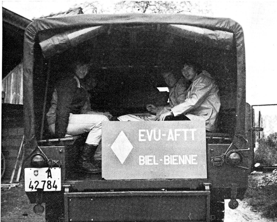
Sektion Biel/Bienne: Bereit zur Abfahrt ins Übungsgelände

Sonntag, den 3. Juli: Uebermittlungsdienst an der Bieler Braderie.