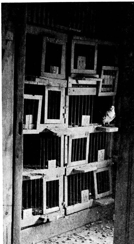
Sicht in einen Teil des Taubenschlages (Brutstätte).

Ces récentes photos prouvent qu'un hobby et qu'un contact étroit avec les animaux maintiennent jeune!