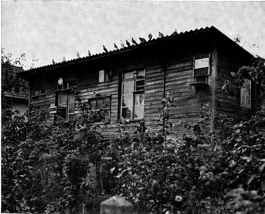
Sicht auf das Brieftaubenhaus mit seinen verschiedenen Ein- und Ausflug-Kontrollnischen

Dazu wird jedem Züchter für den vorgeschriebenen Bestand das Taubenfutter gratis abgegeben. Die Armee hat dafür das Recht, den Sollbestand jedes Armee-Brieftaubenschlages jederzeit zu militarisieren. Und so haben im Laufe der Jahre schon viele Brieftauben-FHD und -Soldaten den prächtig gelegenen Bülacher Schlag (siehe Bild) in Beschlag genommen, wobei die Tauben für militärische Übungen, für Demonstrations- und Wettbewerbsflüge für die Armee, sowie bei Grossanlässen (Landesausstellung und Expo, Olma, internationale Pferdesporttage usw.) in den Einsatz kamen.