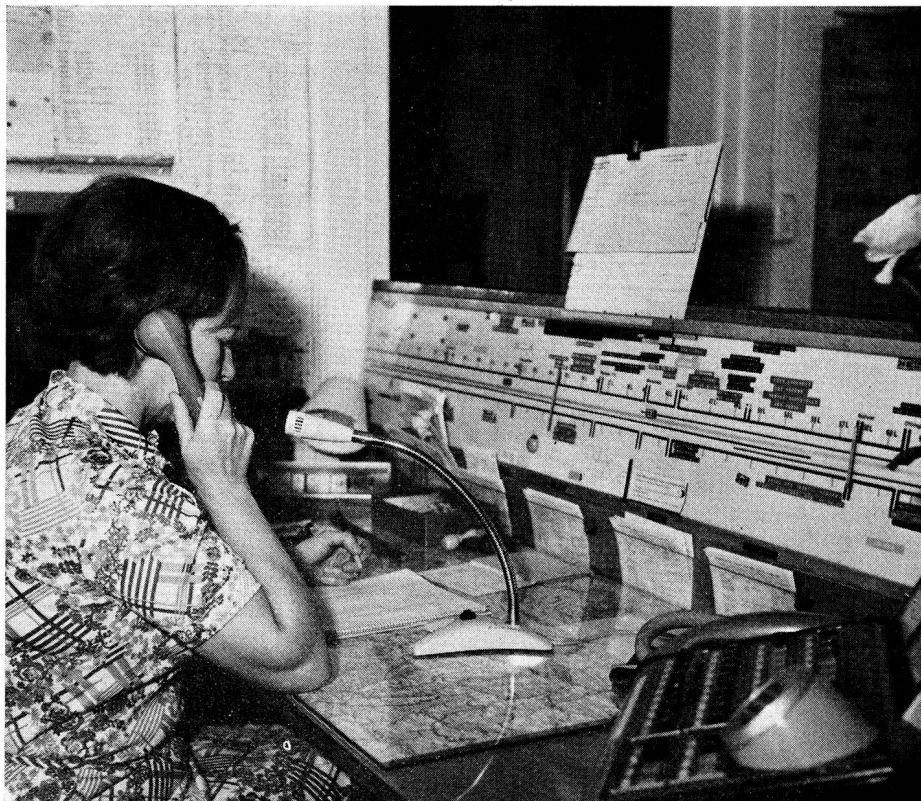
Auf der Pannenhilfezentrale ist die Telefonistin die Weichenstellerin. Sie ist dafür verantwortlich, dass der rechte Mann an den rechten Ort geschickt wird.

Während ihrer Arbeitszeit befinden sich die Patrouilleure auf den Strassen ihrer Region