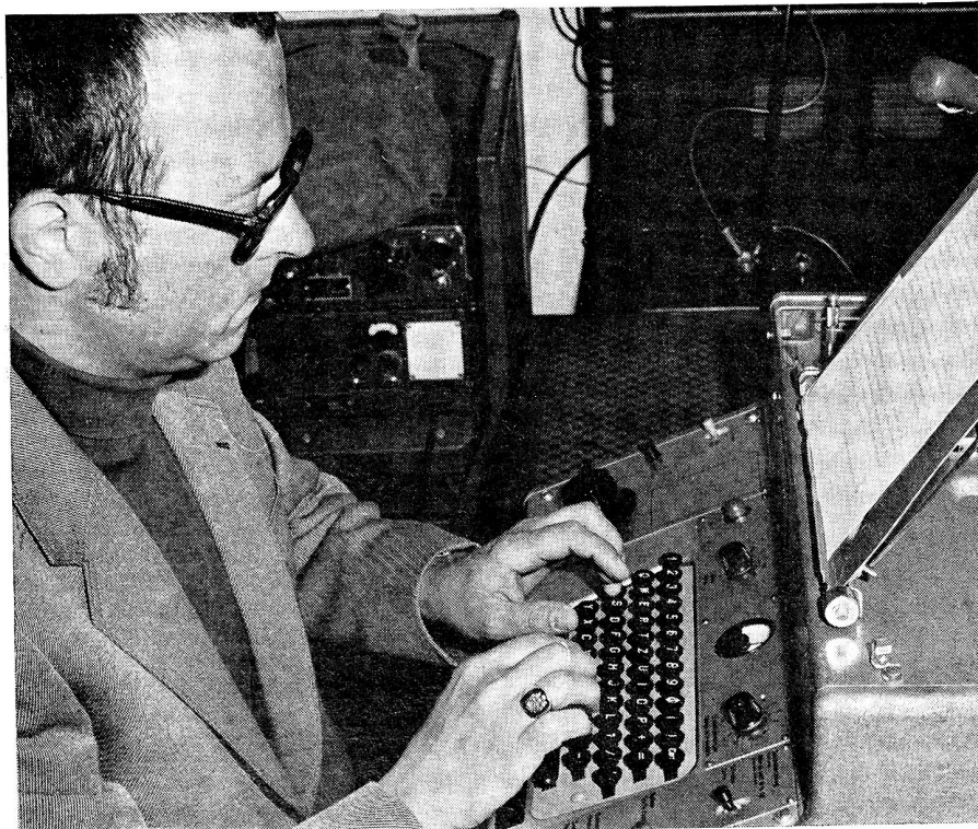
Zwischen Zürich, Uster und Uetikon wurde ein Netz SE-222 aufgebaut, das von Mitgliedern der beteiligten EVU-Sektionen betrieben wurde.

Dank schliesse ich aber auch alle Mitarbeiter an der Uebung selbst ein. «Polyphon» hat die erwarteten und erhofften Resultate erbracht. Wir erhielten wertvolle Unterlagen für unser Katastrophenkorps, aber auch jeder Beteiligte konnte — so hoffe ich — in technischer Hinsicht manches dazulernen.