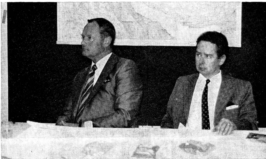
Prominente Gäste an der Übung «Polyphon». Links der Präsident des Zürcher Regierungsrates J. Stucki, rechts der Zentralpräsident des EVU, Major Leonhard Wyss, der auch die Grüsse des Waffenchefs der Uebermittlungsgruppen überbrachte.

vilschutz Uetikon, Herrliberg und Küsnacht, den Verkehrskadetten, aber auch den einzelnen Ressortchefs des EVU für ihre vorbildlich geleistete Arbeit zu danken. Gerade weil das Übungskonzept auf die Schulung der Zusammenarbeit hin ausgelegt war, ergaben sich bei der Planung grössere Probleme als bei einer anderen Übung. Diese Probleme sind in vorbildlicher Weise gelöst worden. In meinen