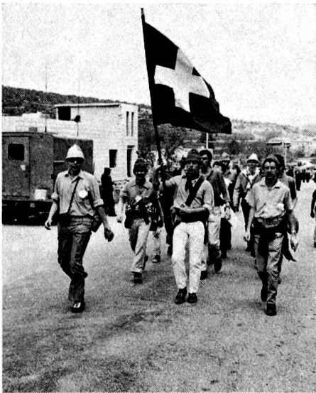
Impressionen vom Israelischen Dreitagemarsch 1971