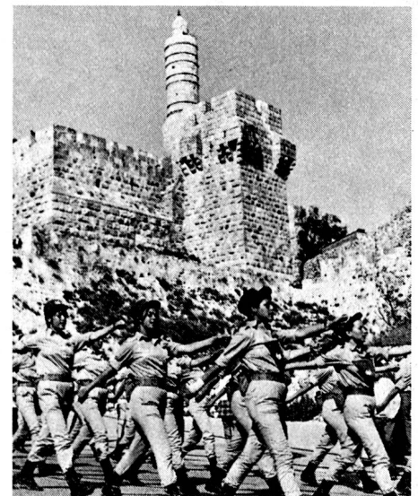
Klasse mit Rasse