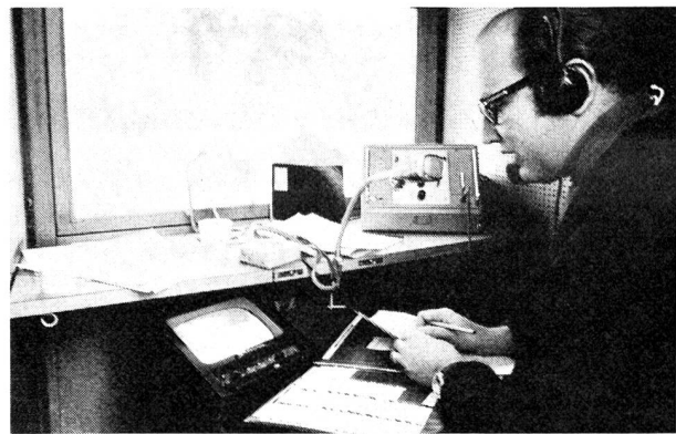
Fig. 5 Fernsehkommentatorkabine mit Blick auf die Zielstrecke. Unterhalb des Fensters der Monitor mit dem Fernsehbild

Nachstehende Angaben des Lauberhornrennens 1969 mögen über dem Umfang des Anlasses orientieren und dessen internationale Bedeutung belegen: