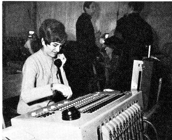
Fig. 2 Fernsehübermittlungszentrum, Bedienungspult für internationale Studio- und Reportageleitungen

Das Lauberhornrennen hat sich, wie viele andere Skianlässe, zu einer Grossveranstaltung entwickelt, an der für die Bedürfnisse der Presseberichterstattung Telefon und Tele-