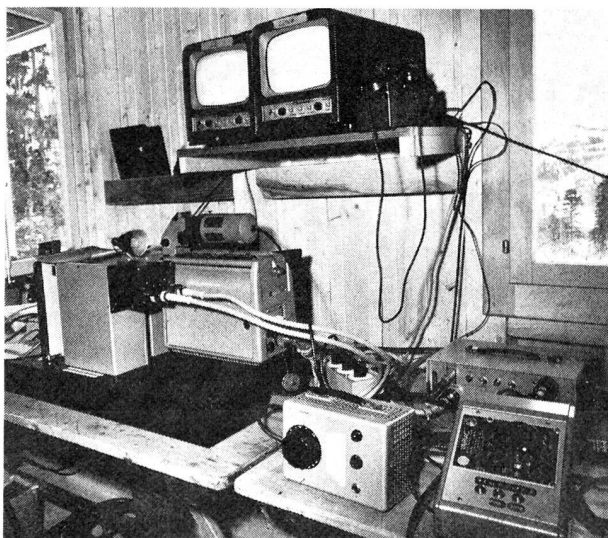
Fig. 4 Ausrüstung zum Einblenden der Zeitmessung (Rennzeit) im Fernseh-Regieraum

Während die hier geschilderten Installationen dem Radio und Fernsehen dienen, konnte mit dem Schulhausneubau in Wengen in dessen Turnhalle ein Pressezentrum eingerichtet werden, das den Erfordernissen in idealer Weise Rechnung trägt. Hier stehen den Journalisten und Radioleuten alle Presseinformationen zur Verfügung (Fig. 10), und