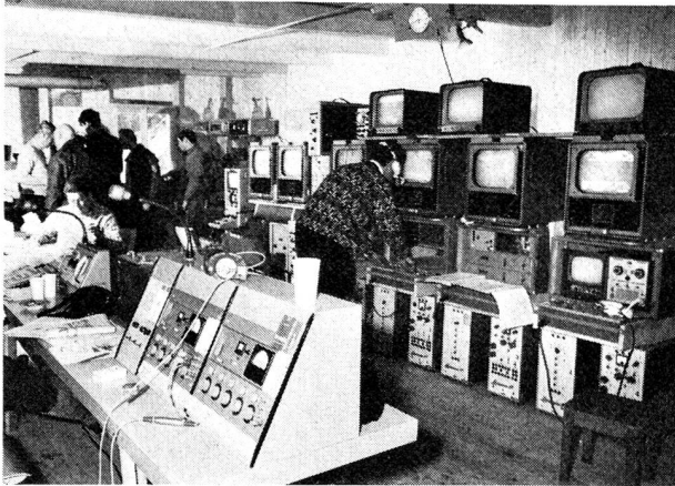
Fig. 3 Fernsehregieraum

Abfahrt und Slalom der Schweizerischen Damenskirennen in den Reporterkabinen in Wengen an Hand des Fernsehbildes des dort installierten Monitors (Kontrollempfänger). In diesem Fall wird die Bildübertragung aus Grindelwald unter Zuhilfenahme von zwei mobilen Richtstrahlantennen über eine Relaisstation auf der Kleinen Scheidegg nach dem Jungfrauoch übermittelt. Dort wird das Bild Richtung Wengen von der Übertragung Albis-Eurovision abgezweigt und mit besonderen Richtstrahlparabolantennen ins Fernsehübermittlungszentrum (Fig. 8) und dann in die Reporterkabine geleitet (Fig. 7).