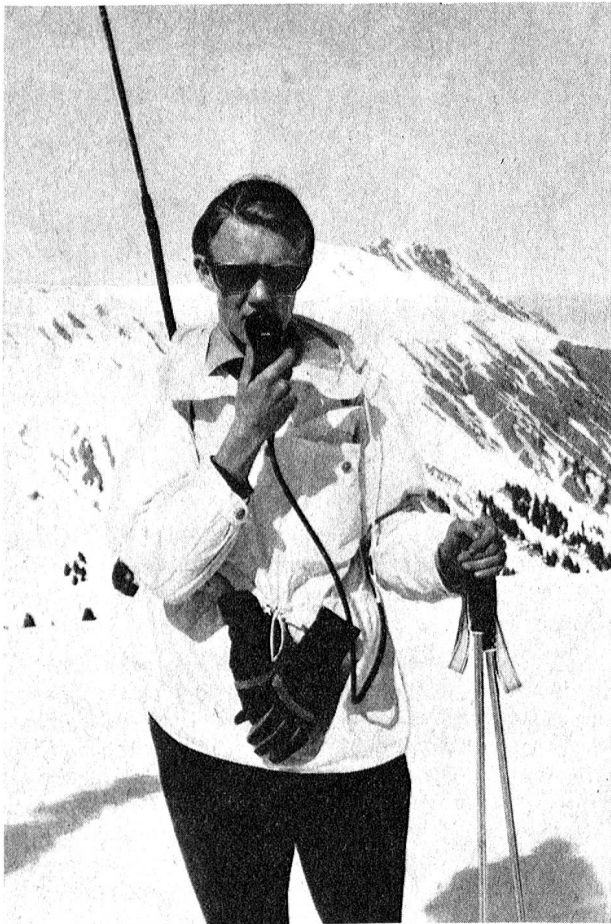
Eines der Jungmitglieder der Sektion Thun des EVU im freiwilligen ausserdienstlichen Einsatz auf dem höchsten Punkt der Strecke vom Sonntag, auf der Höhe des Leiterli, wo er den Durchmarsch der Patrouillen zu melden hatte.

Unser Bildbericht sagt mehr als Worte und gibt auch einen Einblick in die besondere Atmosphäre dieser Leistungsprüfung abseits der Pisten, in der das Mitmachen und Durchhalten, das Erlebnis der Gemeinschaft und der Natur des winterlichen Hochgebirges zählt. Die Kameraden des EVU haben den Patrouillen, rekrutiert aus militärischen Einheiten und Vereinen, dem Grenz- und Festungswachtkorps, städtischer und kantonaler Polizeikorps, den bernischen Fischerei- und Jagdaufsehern sowie des FHD und des Rotkreuzdienstes, einen grossen Dienst geleistet, ihnen unterwegs Sicherheit und Betreuung gewährleistet. Im Namen der Patrouillen und der Organisatoren herzlichen Dank!