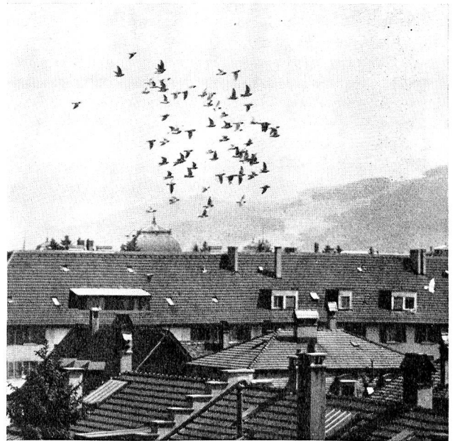
Die geschlossene Gesellschaft kreist über den Dächern der Bundesstadt. Brieftauben sind nicht zu verwechseln mit ihren Artgenossen, den Haus-, Strassen- oder Stadtauben.

Wiewohl solche Wettflüge aus Frankreich, Holland, Deutschland und Österreich dem Brieftaubensport die besondere Note aufdrücken, ist deren Wert doch nicht zu überschätzen. Viel wichtiger ist nämlich, dass die der Armee zur Verfügung zu stellenden Brieftauben in der näheren Umgebung und innerhalb der Landesgrenze bis zu Distanzen von mindestens 100 km auf Selbständigkeit trainiert werden. Denn wie aus vorstehenden Abschnitten hervorgeht, steht keineswegs fest, dass solche Langstreckenflieger im militärischen Einsatz zu zweit auch zuverlässig fliegen. Die Armee gewährt denn auch keinerlei Unterstützung für Auslandflüge. Aber auch innerhalb der Landesgrenze hat jeder Züchter die Möglichkeit, den Leistungsausweis zu erreichen, ohne am Geldspiel der Wettflüge teilnehmen zu müssen. Solche Tauben fliegen dann in der sogenannten Nullklasse oder in besonderen Kontrollflügen.