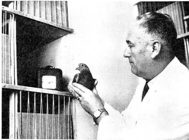
Der soeben vom Wettflug heimgekehrten Brieftaube wurde der Gummiring abgenommen und in die Kontrolluhr gedreht.

Spannung und Erwartung des Züchters, der längst ausgerechnet hat, wann er seine Lieblinge aus der vielhundert Kilometer messenden Distanz empfangen kann, und nun mit erhobenem Blick nach ihnen ausschaut. Da — schon fliegt die erste ein. Schnell wird ihr der Gummiring abgestreift und in die Kontrolluhr gedreht. Diese Uhr konstatiert die genaue Ankunft, also Tag, Stunde, Minute und Sekunde. Eine besondere Uhrenkommission öffnet nach beendigtem Wettflug diese Kontrolluhren und vergleicht die Zeigerstellung mit der sprechenden Uhr. Da diese Uhren bereits vor dem Wettflug nach der sprechenden Uhr eingestellt wurden, können nun eventuelle Differenzen vor- oder nachgehender Uhren bei der Auswertung der Flugresultate berücksichtigt werden. Es wird streng darauf geachtet, dass keine Unkorrektheiten vorkommen. Aus diesem Grunde werden die Kontrolluhren auch nur plombiert ausgegeben. Die Flugresultate werden in Metern pro Minute errechnet und alsdann in einer besonderen Rangliste zusammengestellt. Durch Veröffentlichung im «DERBY» (offizielles Organ des Zentralverbandes) erhalten