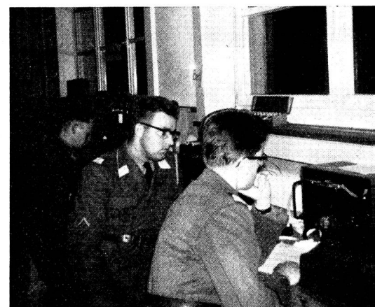
Oben: Einige Sektionen setzten im Rahmen von sektioneninternen Verbindungen neuste Geräte ein. In Solothurn war es eine SE-407, von deren Betriebsraum wir ein Bild zeigen. Mitte und unten: Zwei Schnappschüsse von der konzentrierten Arbeit im Zentrum Aarau.

Presse nicht lobend erwähnt werden musste. In verdankenswerter Weise hatte uns die Schulgemeinde Frauenfeld wieder die Räumlichkeiten der