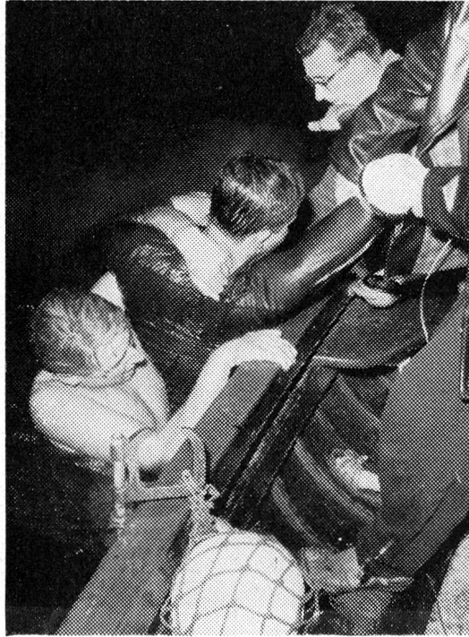
Zwei Schiffbrüchige werden von Rettungsschwimmern ins Rettungsboot gezogen. Dort erhalten sie die erste Hilfe.