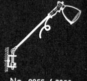
No. 9055 / 9050