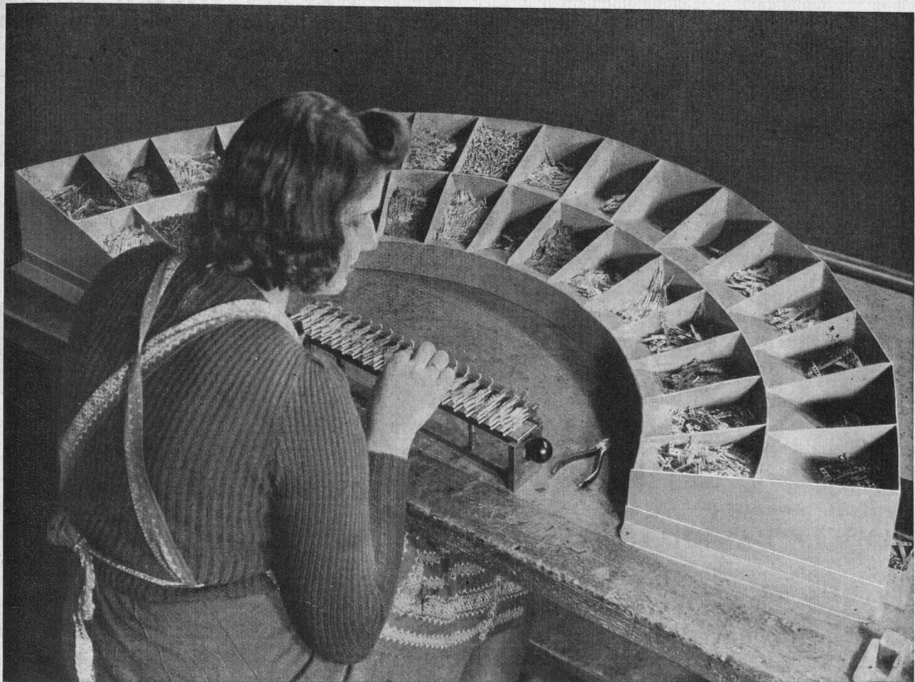
Montageplatz in unserer Fabrik für Federsätze zu Relais