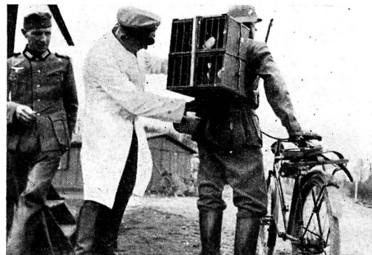
Deutscher Briefftauben-Träger vor der Abfahrt