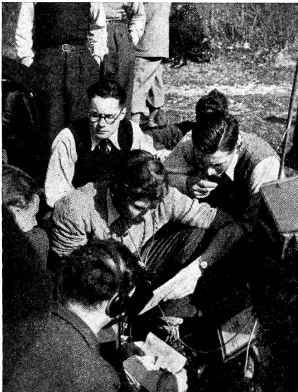
Zensur-Nr. VI 12474 SN

Um 1337 endlich kommt von «Benzin» die erste Meldung, die das Passieren von drei Patr. verzeichnet. Kurz darauf spricht auch «Musikant» von einer Spitzengruppe. Und Minuten nachher folgt Telegramm auf Telegramm! Wie Sie aus dem Programmheft ersehen, laufen auf der fast genau gleichen Piste Of.- und Uof.-Patr. gegeneinander. Der äusserst rege Verkehr rührt also