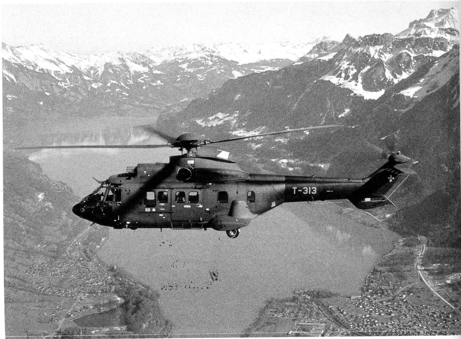
Aufnahme: Militärflugdienst Dübendorf