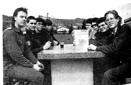
Man zeigt sich auf dem Titelblatt des PIONIER.