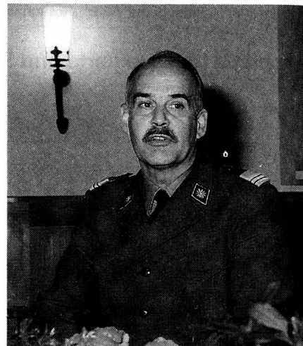
Ausführungen des Schulkommandanten und der weiteren Redner.