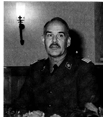
Ausführungen des Schulkommandanten und der weiteren Redner.