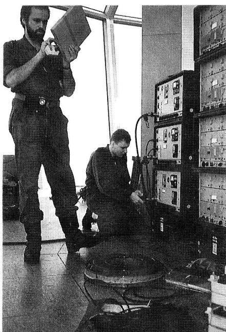
Ein Teil der Anlagen in der Richtstrahlkancel.

mit Mikroprozessor-Systemen eine Handhabungs-Schulung rechtfertigen. Doch diese Diskussion können wir nicht hier führen. In unserem Sendelokal haben wir nun wieder Grossbetrieb mit den