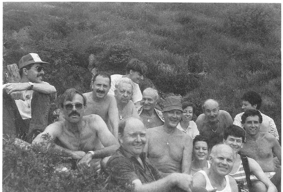
Felici e contenti.