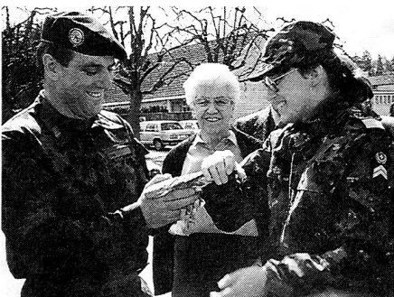
«Begegnung»: Besuchstag der RS4 in Liestal am 6. 4. 1991; Werbung für den MFD.

Eine weitere Aufgabe unseres Verbandes bestand in der Werbung für den Frauenhilfsdienst. So organisierte der Vorstand 1954 eine Werbekampagne in verschiedenen Gemeinden des mittleren und oberen Baselbietes. Der Zeitaufwand war gross, die Werbeabende gut besucht, die Anmeldungen jedoch gering.