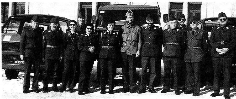
Winterwettkampf Andermatt 1991

wohnheit gewordenen angenehmen und «süßen» Überraschung.